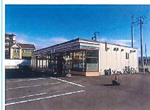
セブンイレブン長泉町本宿店

※この図面はATBBの物件情報の一部を抜粋して掲載しております。(現況優先) ※入居口・引渡日変更や付帯条件、別途料金が発生する場合がありますのでご確認ください。