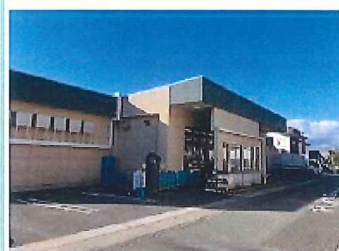
スーパーカドイケ本店